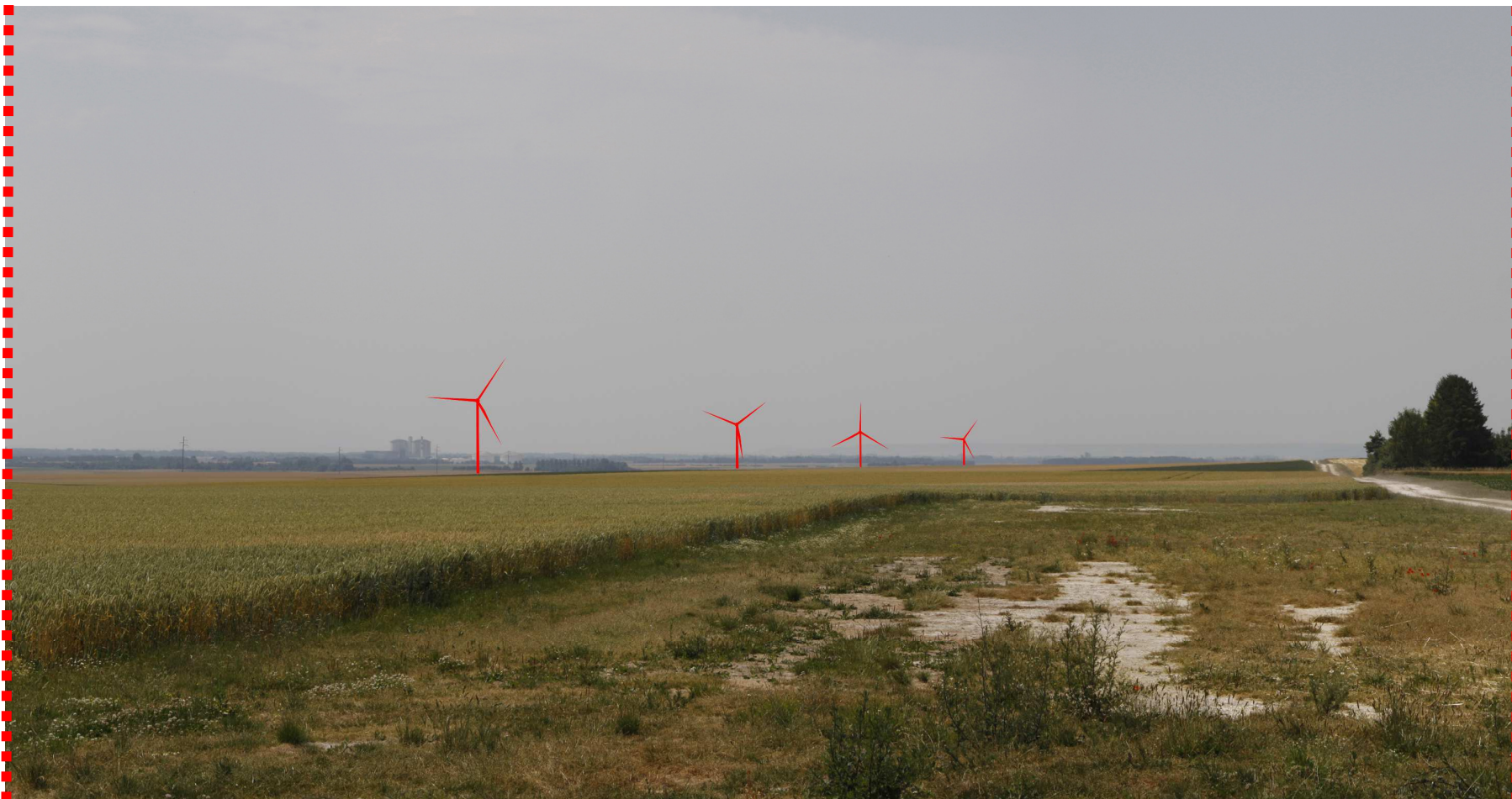
Photomontage d'interprétation recadré à 60°