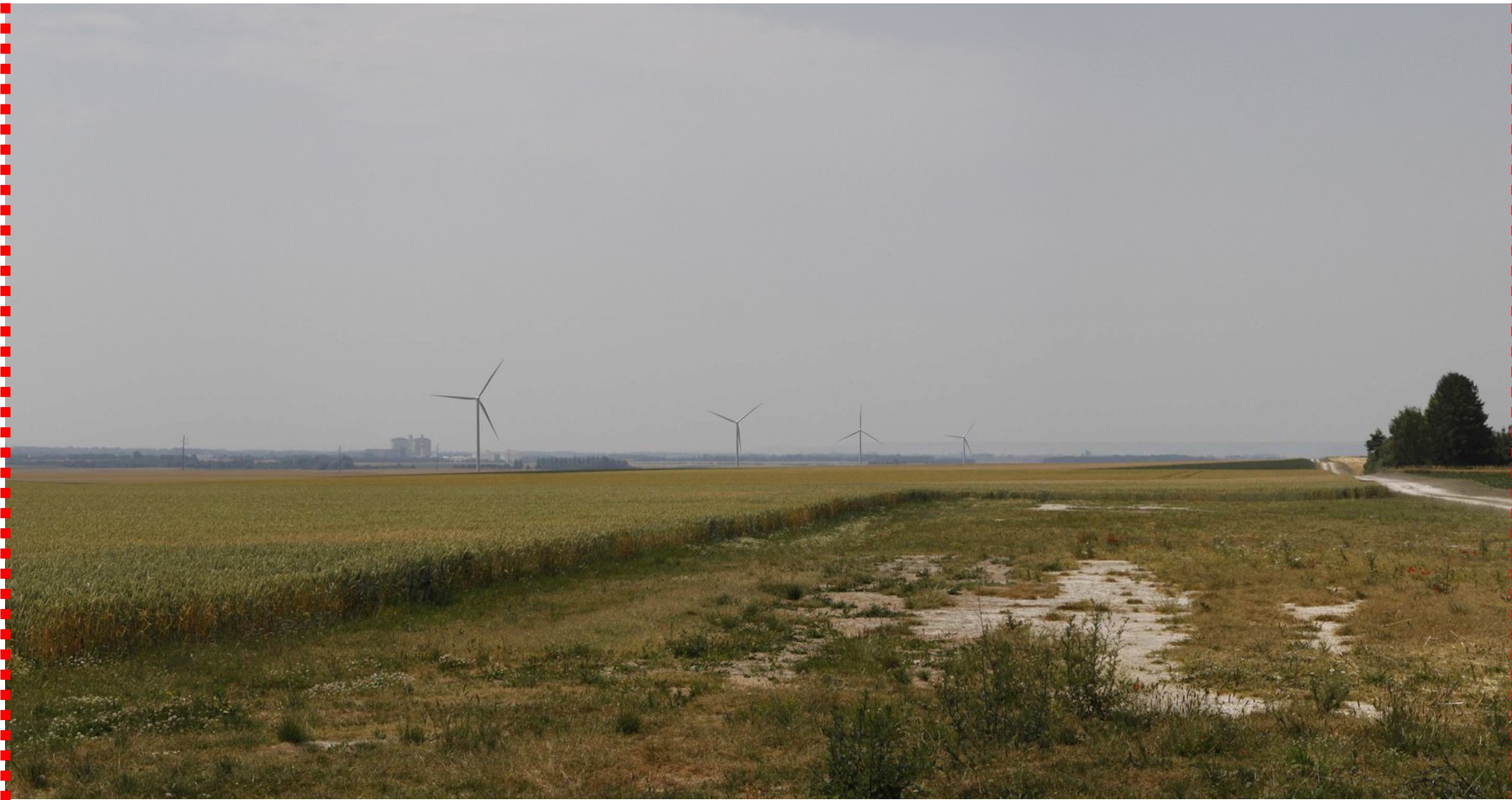
Photomontage recadré à 60°